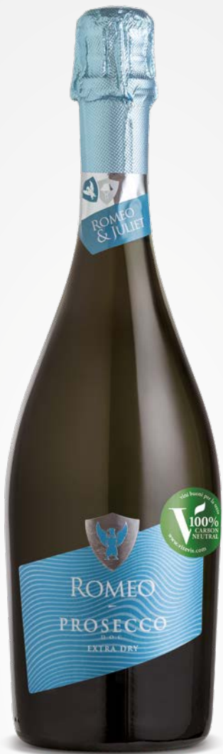
Romeo & Juliet PROSECCO SPUMANTE DOC EXTRA DRY ROMEO 0.75 Lt