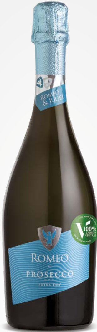
Romeo & Juliet PROSECCO DOC "ROMEO" SPARKLING EXTRA DRY 0.75 lt